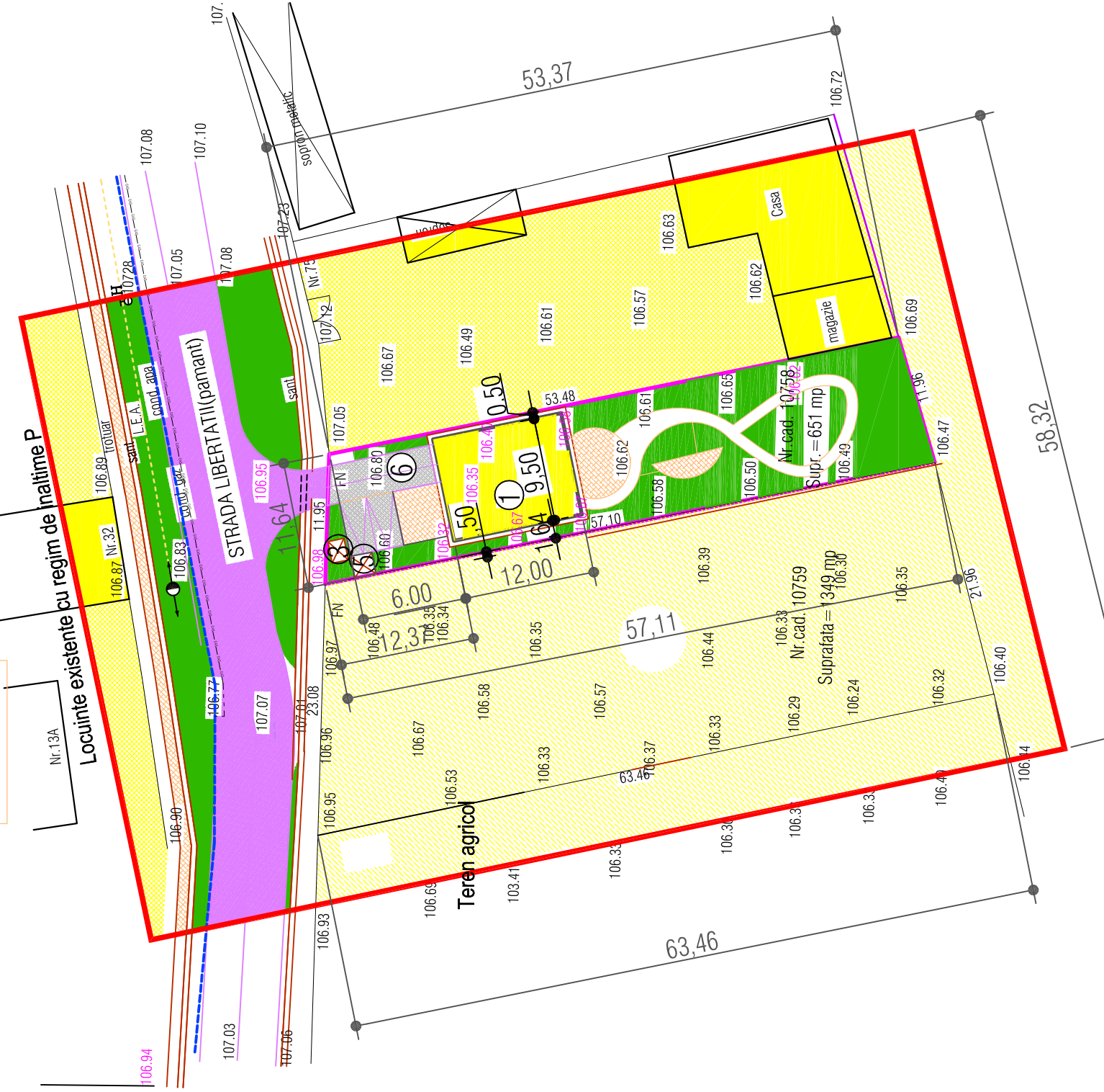
BILANȚ TERITORIAL, (EXISTENT ȘI PROPUS) ZONA STUDIATA