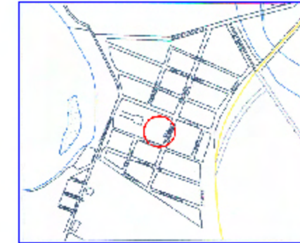
PLAN DE INCADRARE IN ZONA SC. 1:10.000